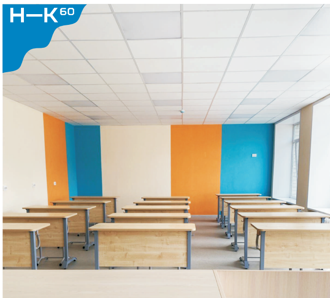
ЛИЦЕЙ № 3