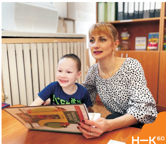
ИНДИВИДУАЛЬНАЯ РАБОТА С РЕБЁНКОМ