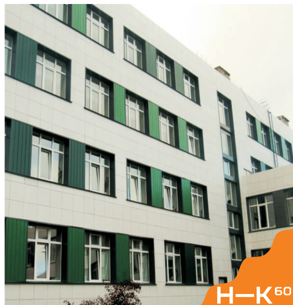
ШКОЛА № 6