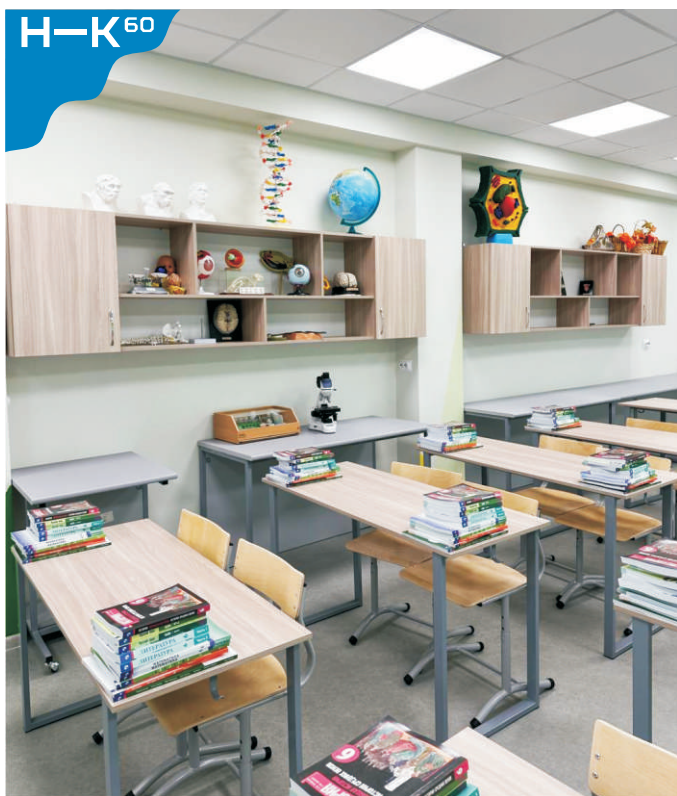
ЛИЦЕЙ № 14