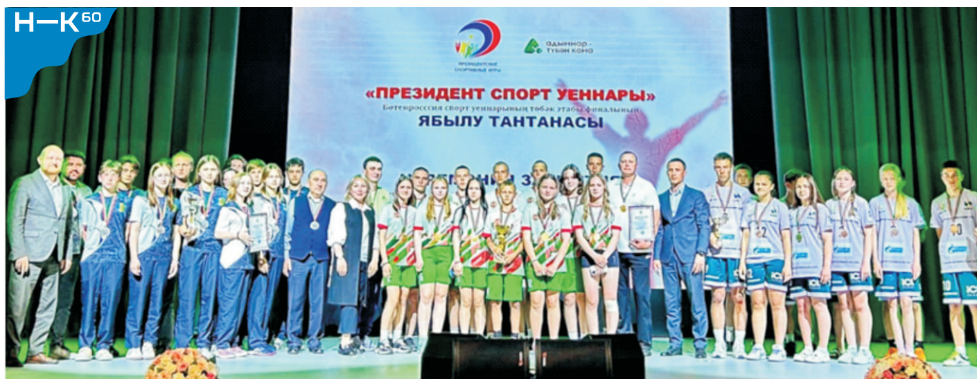
Региональный этап всероссийских игр школьников «Президентские спортивные игры» - 2 место, школа № 29